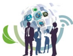
Figura 1 - Fases do Projeto segundo metodologia EPROJSC